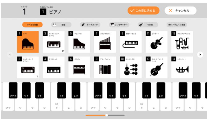
楽器を選択する画面