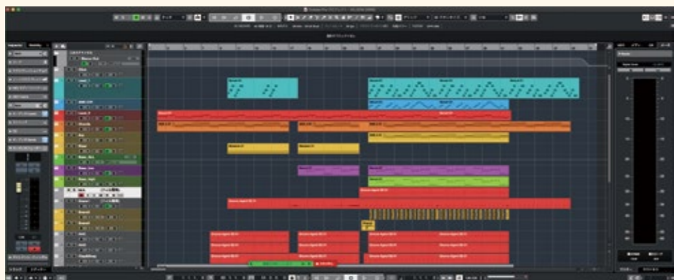
(参考)DAWソフトによる音楽制作の画面

コンピュータの発展とともに、音楽をコンピュータで制作する「DTM(デスク・トップ・ミュージック)」が進化し、近年ではDAW(Digital Audio Workstation)ソフトによる音楽制作が主流となっています。MOUSA2では、その基本的な制作の流れを参考に紙面を構成し、デジタル・コンテンツを活用した創作につながるようにしました。