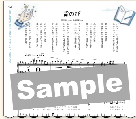
(教科書 P.92 ~ 94)

この教科書のために書き下ろされた、歌人の木下龍也氏作詞、佐井孝彰氏作曲による混声三部合唱曲《背のび》を掲載しています。 親しみやすい曲調と、生徒の日常に寄り添った共感を覚える歌詞により、声を合わせて歌う楽しさを実感しやすい作品です。