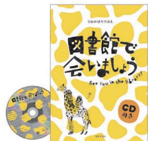
弓削田健介作品集『図書館で会いましょう』(教育芸術社)

2017年11月に寄贈した図書館車は、神戸市立図書館より譲り受けた緑色のバス。長い船旅を経て南アフリカに到着した図書館車は今、どこで、どんなふうに活躍しているのでしょうか？