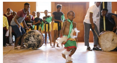
この地域に伝わる“Bees (蜂)”と呼ばれる民族舞踊

そのような事情を抱えながらも、実際に接した子どもたちはびっくりするほど人なつこく、目が合うと満面の笑みを返してくれます。教室をのぞくと、プリントの問題を一生懸命に解いたり、おしゃべりをして先生に注意されていたりと、日本と変わらない光景を見ることができました。