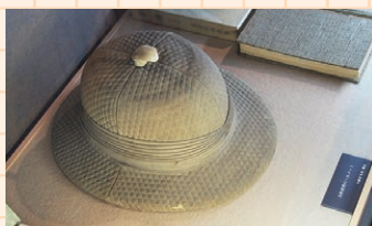
▲白秋愛用の帽子。さまざまな白秋にまつわる展示物が並ぶ