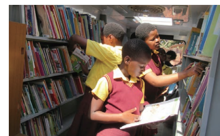
真剣に本を探す子どもたち