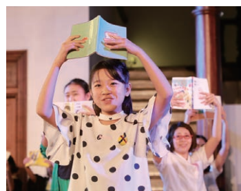
作品集をもとにしたミュージカルやコンサートも行われた