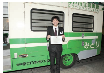
南アフリカ大使館で行われた移動図書館車の出港式(2017年11月)