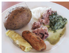
給食の例。いも類、ほうれん草のあえもの、豆料理など

私たちが訪問したムブジニ小学校は、先生が16名、児童数が約500名の中規模の学校でした。モザンビーク国境付近に位置しており、移民の子も多く在学しているそうです。子どもたちは国から支給された制服を着ているので、一見貧しいようには見えませんが、先生によると、家庭で十分な食事がとれず、給食を食べることが目的で学校に通っている子も少なくないそうです。