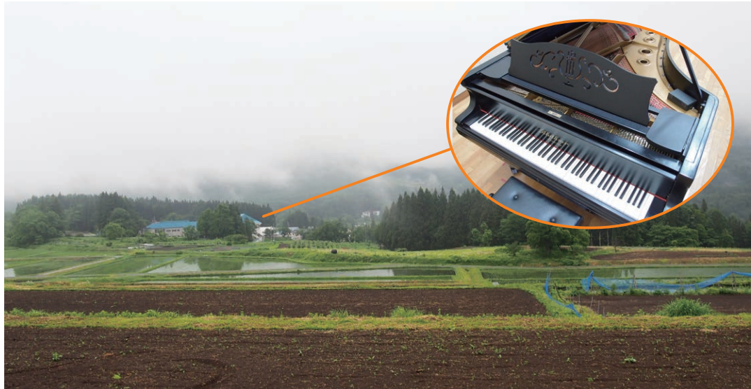
左奥に見える青い三角の屋根が「ブリュートナーピアノ」が置かれているすががかわ体育館(旧北小学校体育館)

ドイツを代表するピアノメーカー、ブリュートナー社製のピアノが、長野県山ノ内町のすががかわ体育館(旧北小学校体育館)に置かれています。本来は大きなコンサートなどで弾かれるような非常に高価なピアノですが、さまざまな偶然を経て小学校にたどり着きました。地域のかたがたから「ブリュートナーピアノ」と親しまれ、長年大切にされているこのピアノの歴史をレポートします。