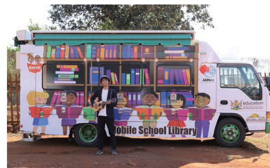
カラフルなペイントで生まれ変わった移動図書館車(2019年9月)

そこには生まれ変わった図書館車の姿がありました。アフリカらしいカラフルなペイントが施され、赤土の大地に何ともマッチした車体。しっかりとメンテナンスされ、舗装されていない砂利道でも安心して走ることができそうです。感慨深く眺めていると、子どもたちが歌を歌いながら列をなして図書館車のほうへやってきました。朗々としたコール・アンド・レスポンスを響かせながら、くっつくのない笑顔で近づいてくる子どもたち。「シスワティ(SiSwati)」という現地語の歌で、「日本の皆さんが図書館車を届けてくれたおかげで、本が読めるようになりました。ありがとう」という内容だそうです。