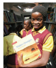
6年生の女子。環境に関する本に興味があるという

先生はさらに続けてこうおっしゃいました。「本は英語力を付けるだけでなく、子どもたちが自身の可能性を広げ、夢を見つけるためのツールなんです。この小さな村に住んでいても、本があれば世界中のことを知ることができますから。」図書館車は本だけでなく、子どもたちの未来をも運んでいるのだと確信した瞬間でした。