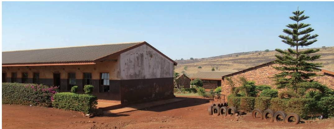
ムブジニ小学校 (Mbusuzini Primary School)

南アフリカの中でも、観光客が訪れるケープタウン、ビジネス街として発展したヨハネスブルグなど、都市部の一部に限ると貧しさはそれほど感じられないかもしれません。しかし、そうしたエリアを離れると、全く違う光景が広がります。バラックが立ち並ぶ居住区や、地元の人でさえ足を踏み入れるのをためらうほど毎日のように犯罪が起こっている地区も少なくありません。