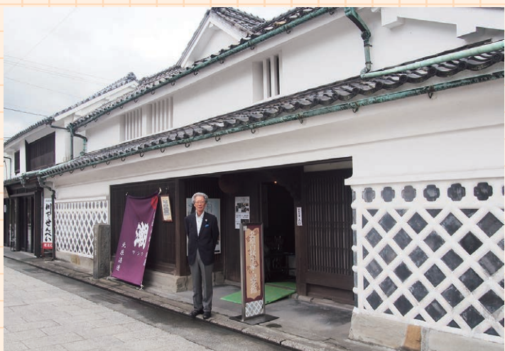
▲北原白秋記念館の入口