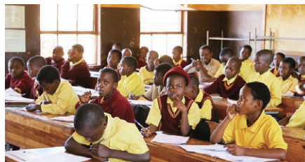
教室での授業風景

南アフリカの義務教育は初等教育7年、中等教育2年の計9年間です。小学校3年生までは母語*を併用しながら授業が行われるのに対し、4年生以上は全教科を英語で学ぶカリキュラムであることから、英語力の不足が学力の低下につながるという連鎖があります。英語の読解力を付けるためにも読書活動が必要であると言われてはいますが、図書室が設置されている学校は国全体で3割にも満たないのが現状です。